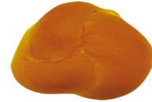
フラワーロール(卵・乳無しパン)