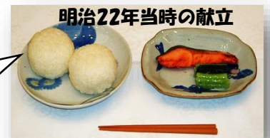
明治22年当時の献立

日本の学校給食は明治22(1889)年、山形県鶴岡市で始まりました。戦争による中断を経て、昭和22(1947)年1月から都市部の小学校を中心に再開。昭和29(1954)年には学校給食法が制定され、学校教育の一環として位置づけられています。そして今日まで日本の子どもたちの健やかな成長を支え続けています。