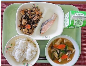
4月:1年生初めての給食