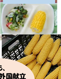
7月:地場産 とうもろこし