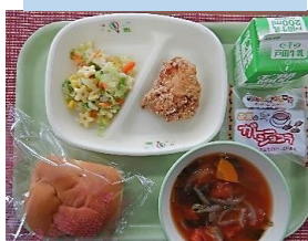
12月:クリスマス献立