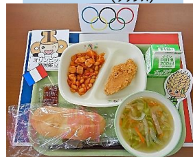
7月:リビッ 献立 (ワラス)