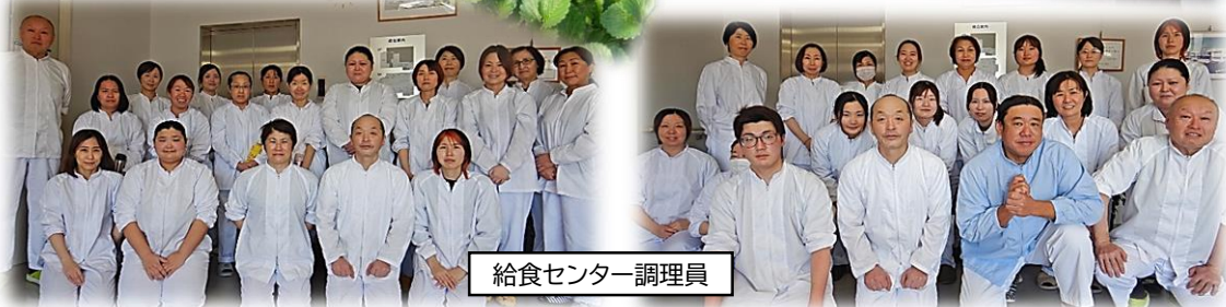
給食センター調理員

たくさんの人に美味しいいちごを届けられるように心を込めて作っています。おいしいなと思ってもらえたら嬉しいです。